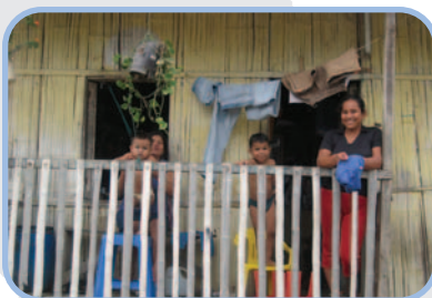
Les maisons traditionnelles sont construites en .....