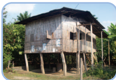
De nombreuses maisons sont construites sur pilotis parce que .....