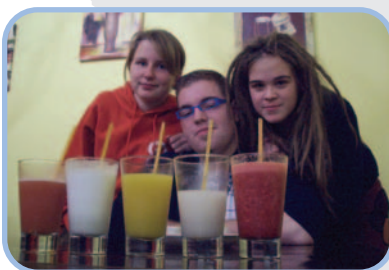
Nous ne savons plus quel jus frais choisir... Il y a ici une grande variété de ..... différents !

Quel est le lien entre ces deux photos ?