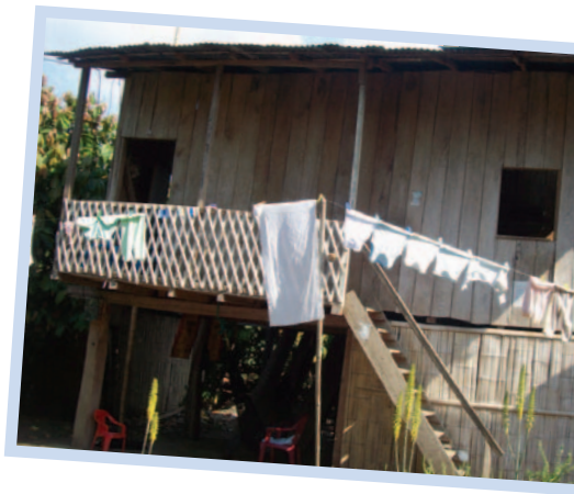
La maison de Dayana.