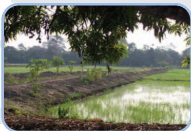
Ces champs sont des .....

Nous avons pris ces photos en chemin. Que t'apprennent-elles sur cette région ?